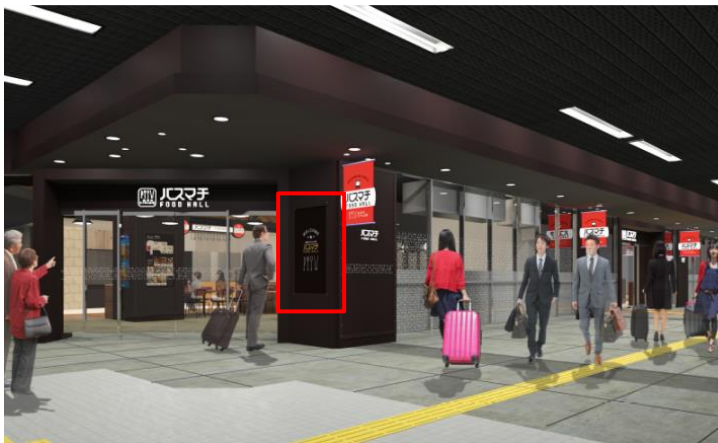
[メインエントランス]

エントランス外に設置するサイネージ（1基）では、フードホールの魅力等を配信することで、エリア内への誘因を強化します。